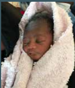
ACEL è nato in sicurezza