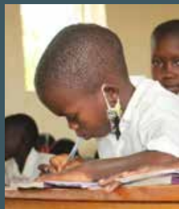
ISAC va a scuola