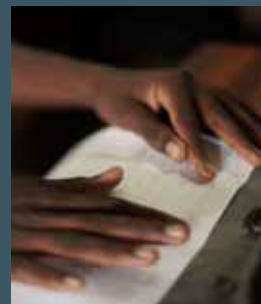
BAKITA impara il Braille