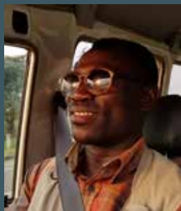
OPIO guida l'ambulanza